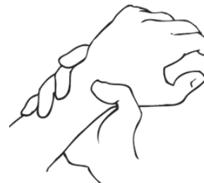
6. Handgelenke einreiben