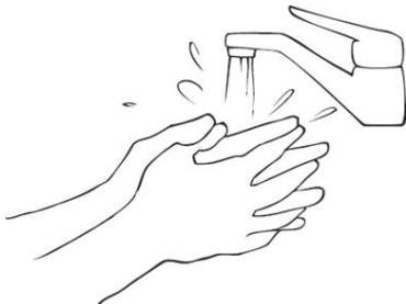
7. Unterarme und Hände abspülen