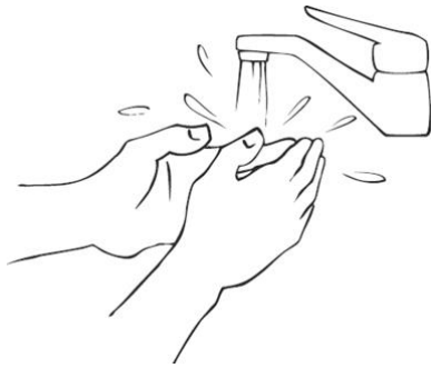
1. Hände nass machen