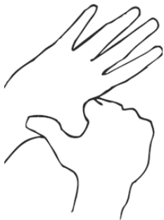
5. Kreisförmiges Reiben der Daumen und Finger in der anderen Handfläche