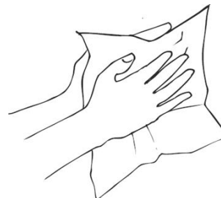
8. Hände und Unterarme abtrocknen