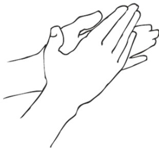
3. Handflächen aneinander reiben