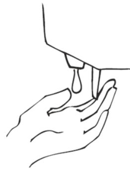
2. Seife verwenden