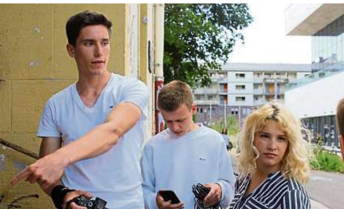
Das Team von „Schritte in die Zukunft“ bei der Vorbereitung einer Filmszene.

QR-Code scannen und Videobeitrag zum Thema anschauen!