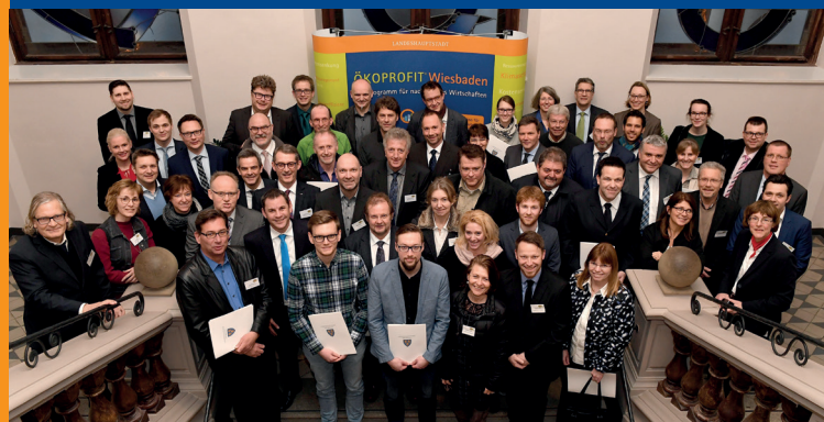
Die Wiesbadener ÖKOPROFIT-Betriebe 2017 und der ÖKOPROFIT-Bus

Umweltamt Wiesbaden Tel.: 0611 313741 umweltmanagement@wiesbaden.de www.wiesbaden.de/oekoprofit