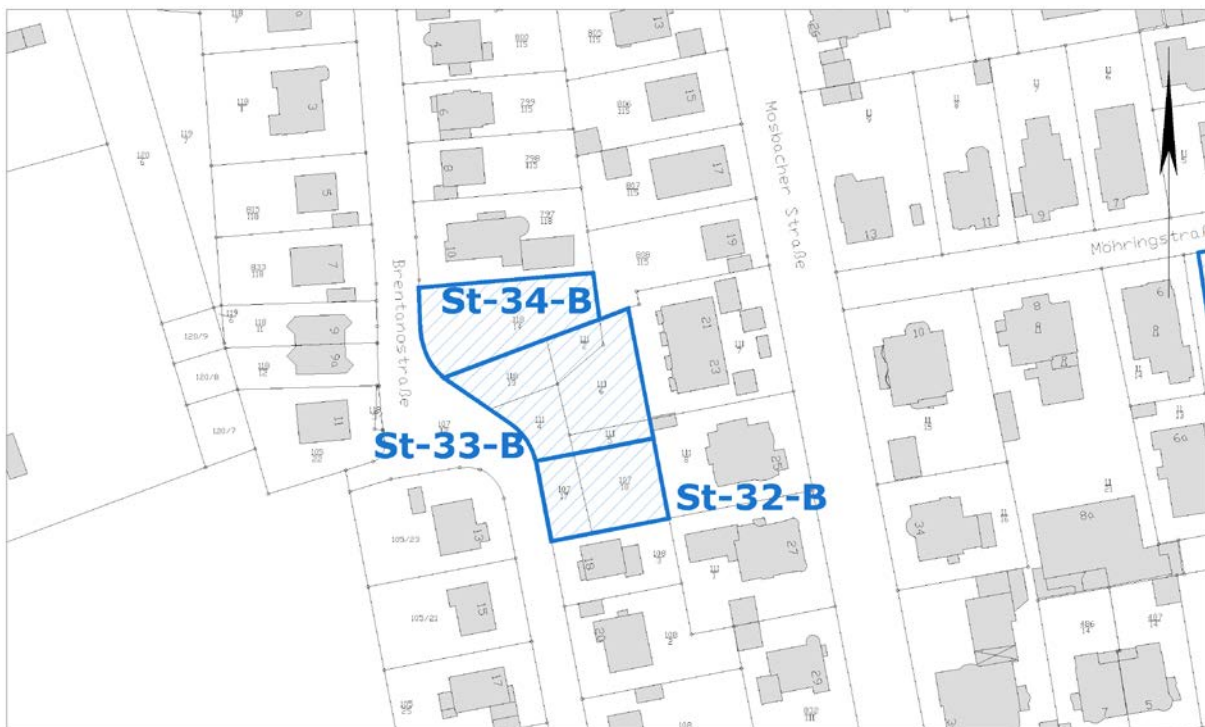
Ausschnitt aus der Stadtgrundkarte

Anmerkungen: Angrenzend Denkmalschutz (Kulturdenkmal, Umgebungsschutz gemäß § 16 (2) HDSchG)