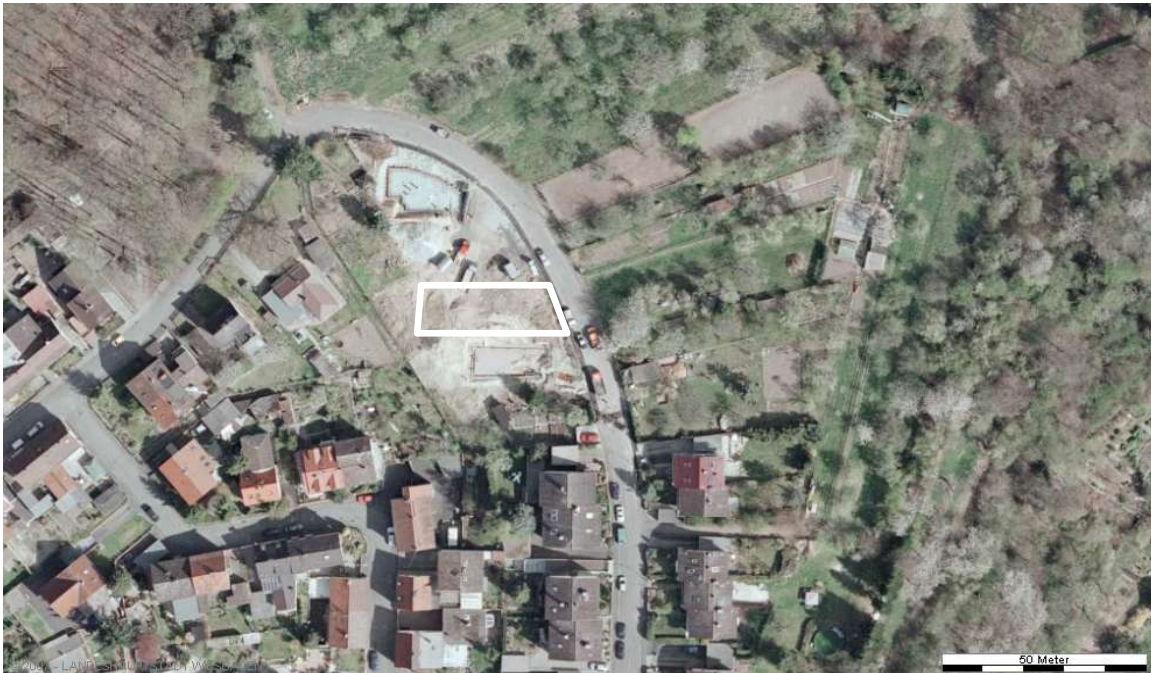
Luftbild (April 2003)