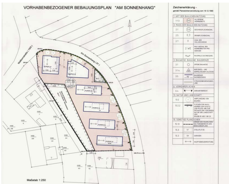
Ausschnitt aus dem Bebauungsplan

Erstellt: Stadtplanungsamt Gustav-Stresemann-Ring 15 65189 Wiesbaden stadtplanung@wiesbaden.de