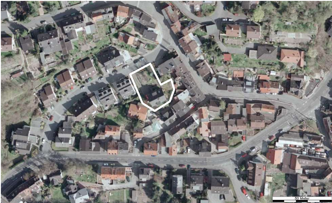
Luftbild (April 2003)