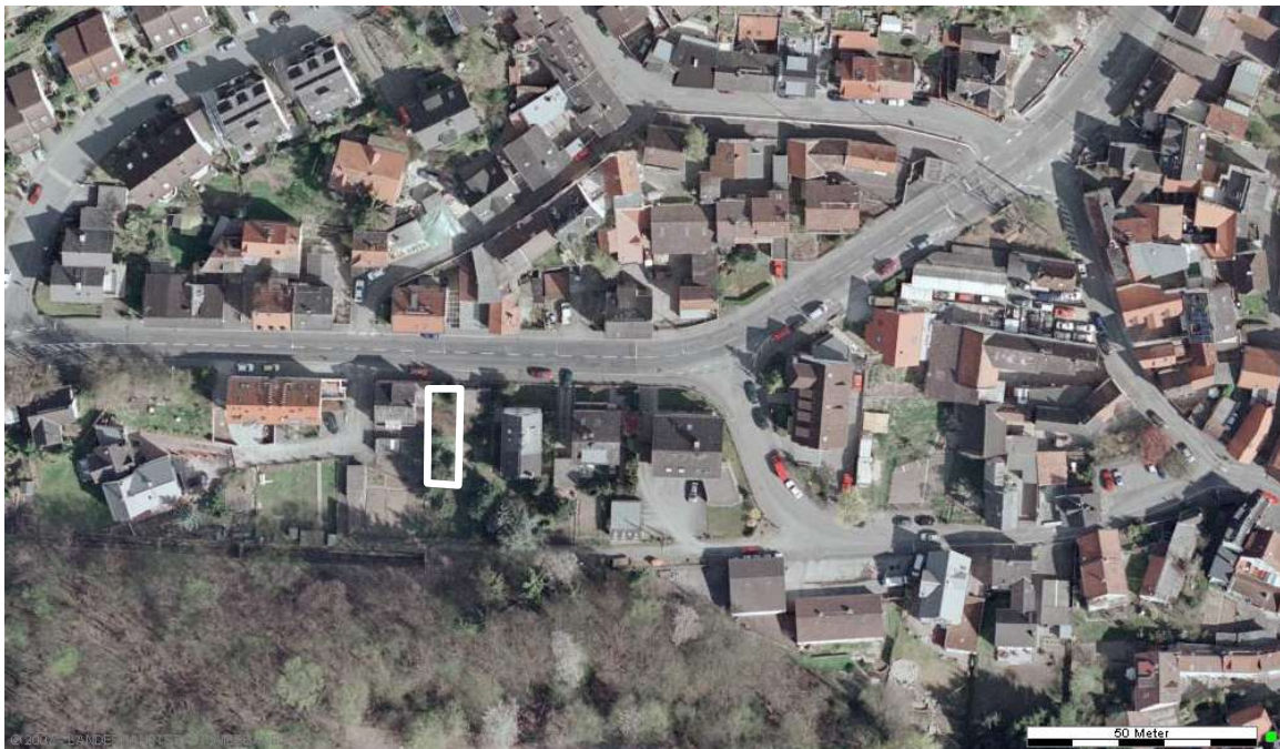
Luftbild (April 2003)

Erstellt: Stadtplanungsamt Gustav-Stresemann-Ring 15 65189 Wiesbaden stadtplanung@wiesbaden.de