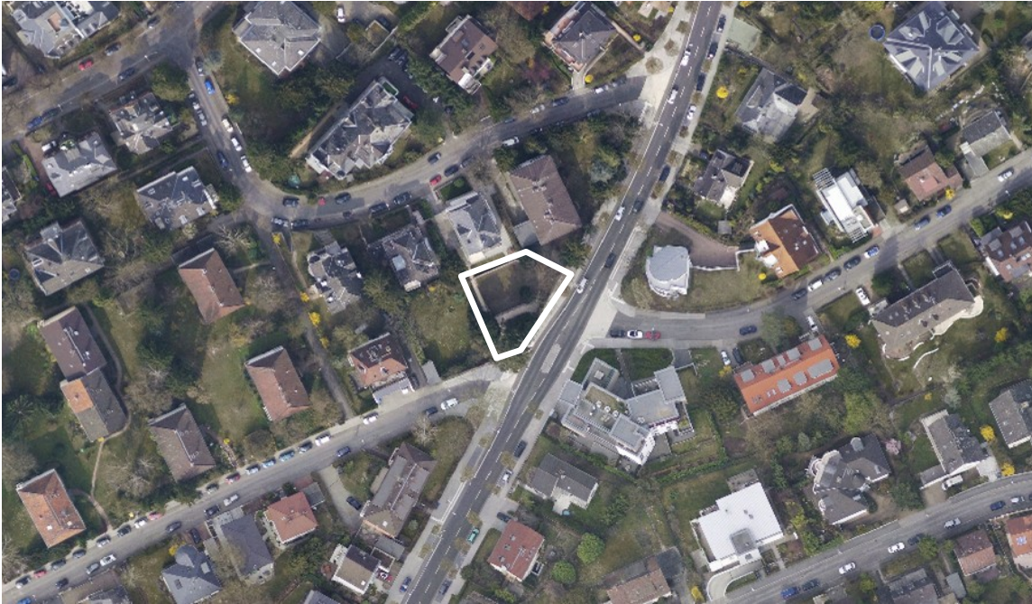
Luftbild (März 2011)