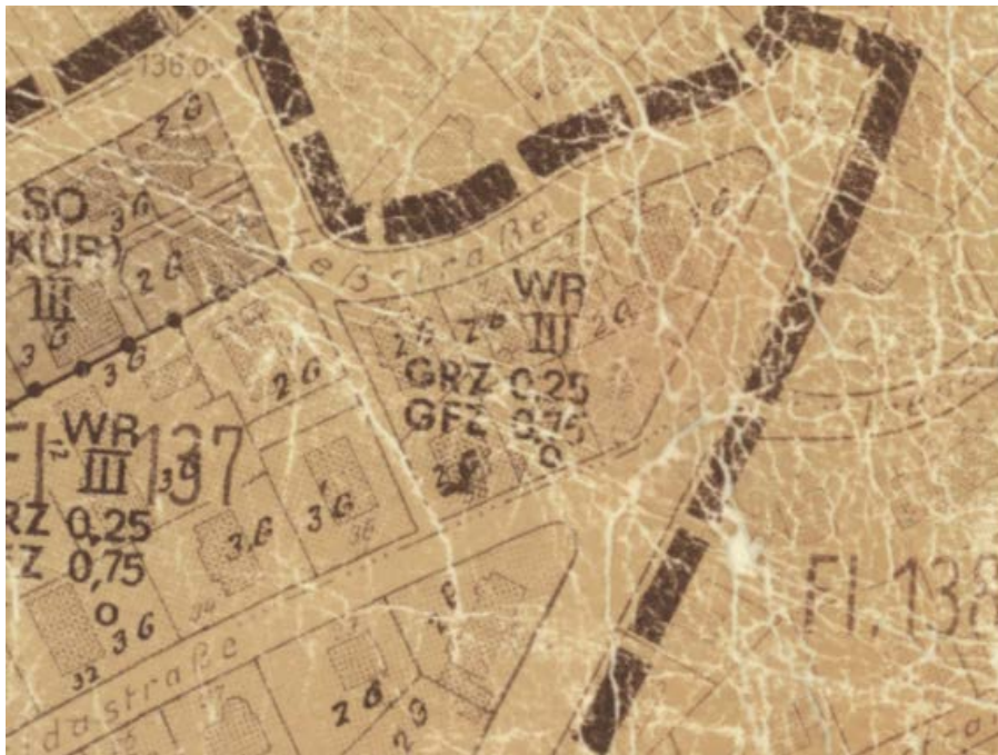
Ausschnitt aus dem Bebauungsplan

Erstellt: Stadtplanungsamt Gustav-Stresemann-Ring 15 65189 Wiesbaden stadtplanung@wiesbaden.de