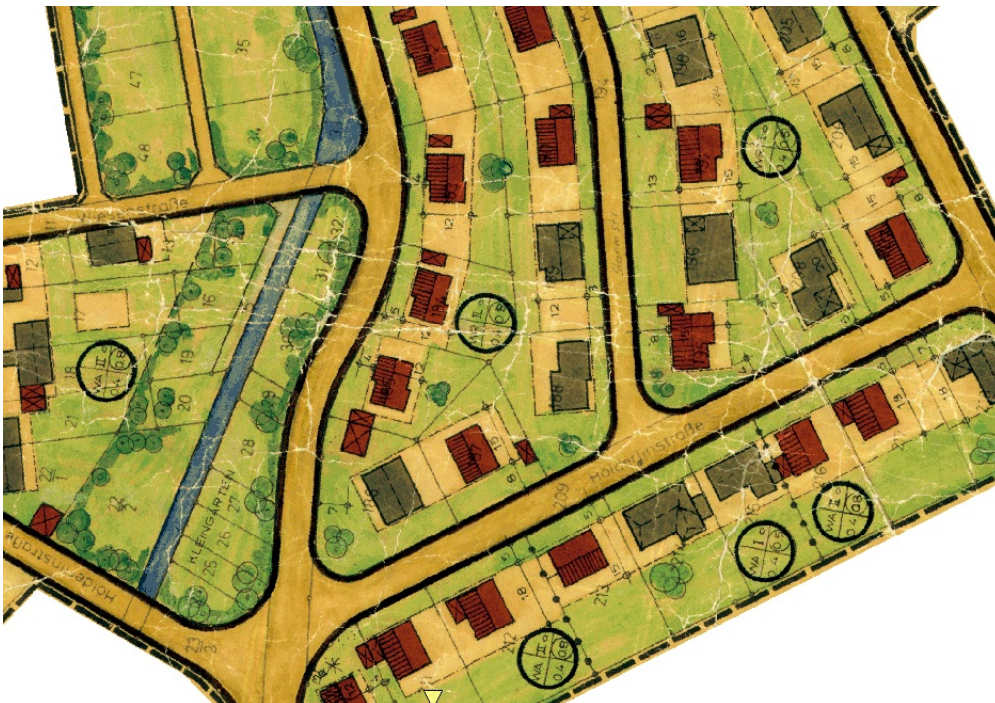
Ausschnitt aus dem Bebauungsplan

Erstellt: Stadtplanungsamt Gustav-Stresemann-Ring 15 65189 Wiesbaden stadtentwicklung@wiesbaden.de