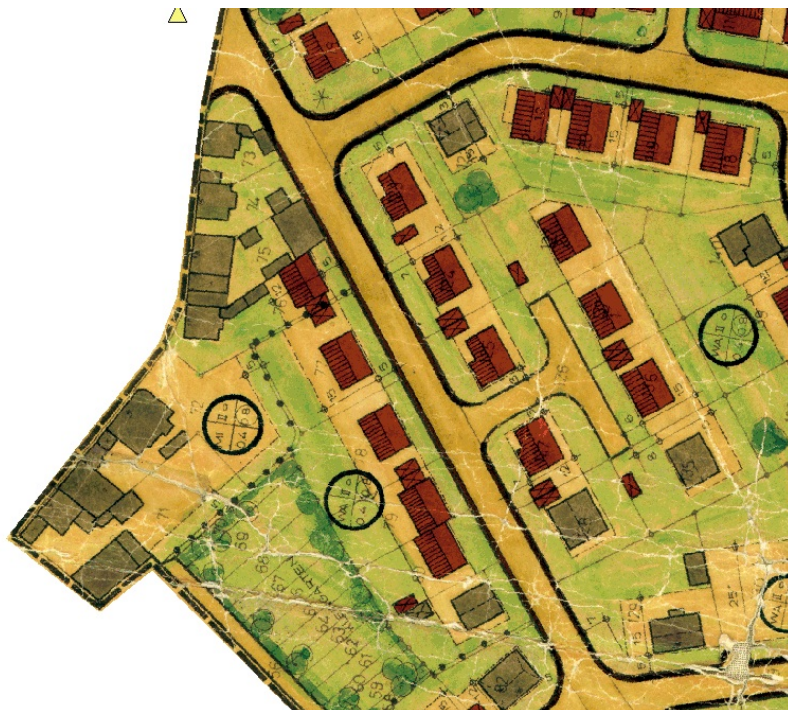
Ausschnitt aus dem Bebauungsplan

Erstellt: Stadtplanungsamt Gustav-Stresemann-Ring 15 65189 Wiesbaden stadtentwicklung@wiesbaden.de