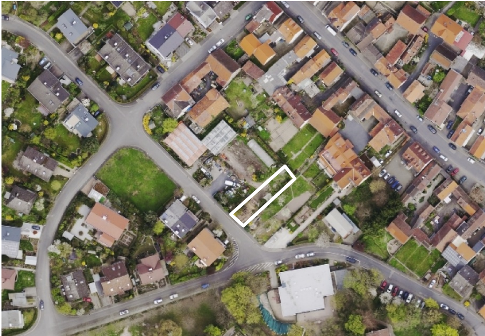
Luftbild (März 2014)

Erstellt: Stadtplanungsamt Gustav-Stresemann-Ring 15 65189 Wiesbaden stadtentwicklung@wiesbaden.de