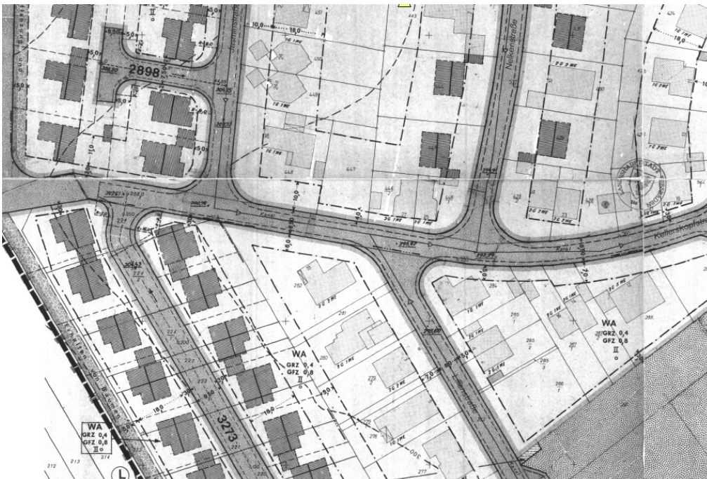
Ausschnitt aus dem Bebauungsplan

Erstellt: Stadtplanungsamt Gustav-Stresemann-Ring 15 65189 Wiesbaden stadtentwicklung@wiesbaden.de