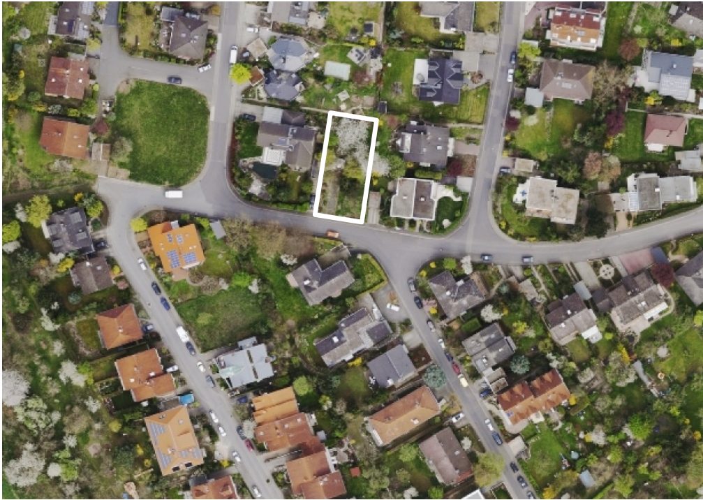
Luftbild (März 2014)