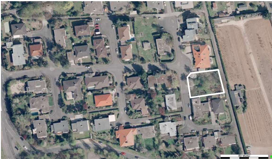
Luftbild (April 2003)