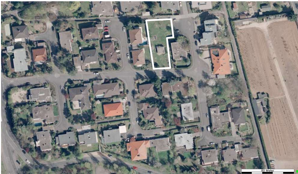
Luftbild (April 2003)