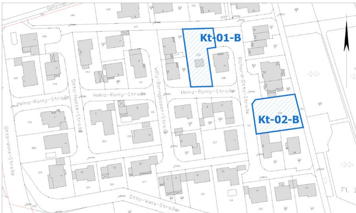
Ausschnitt aus der Stadtgrundkarte