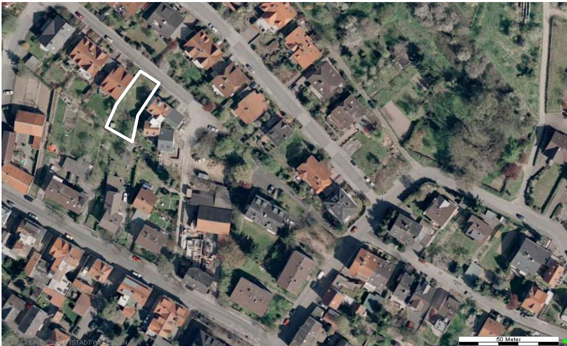
Luftbild (April 2003)