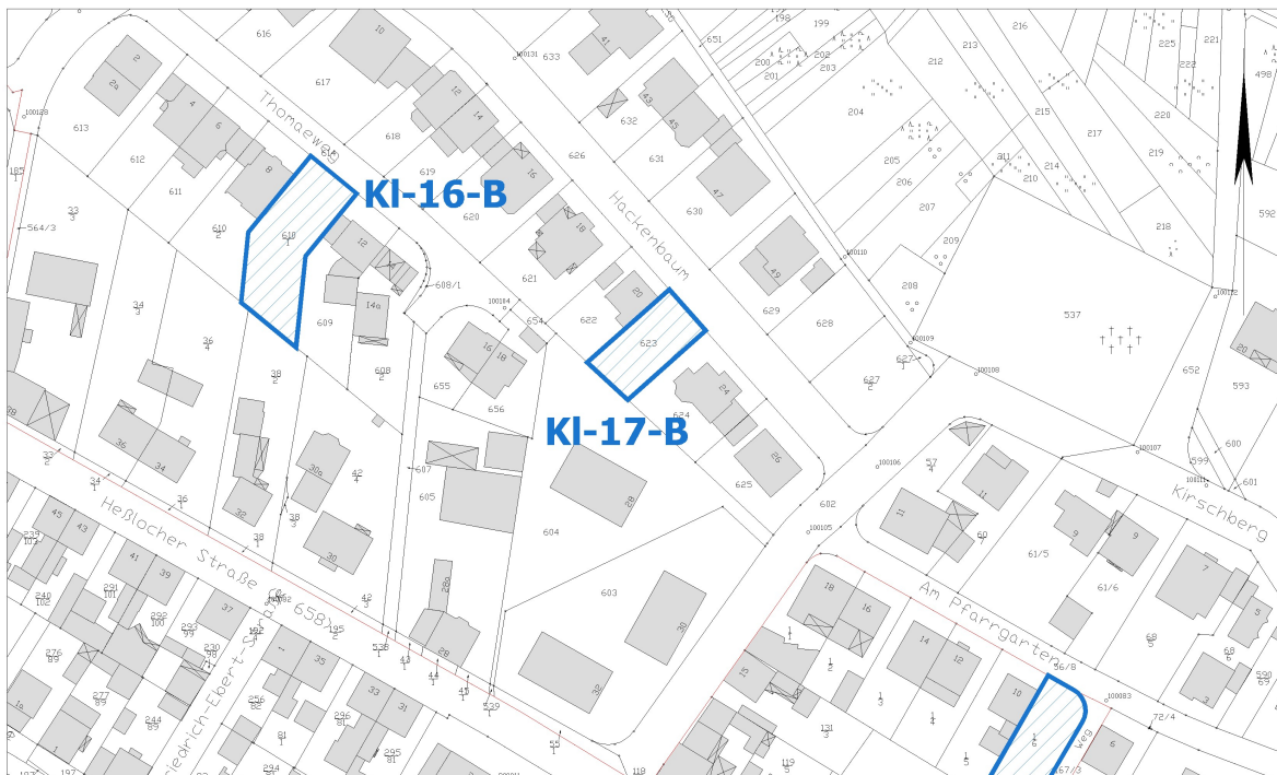
Ausschnitt aus der Stadtgrundkarte