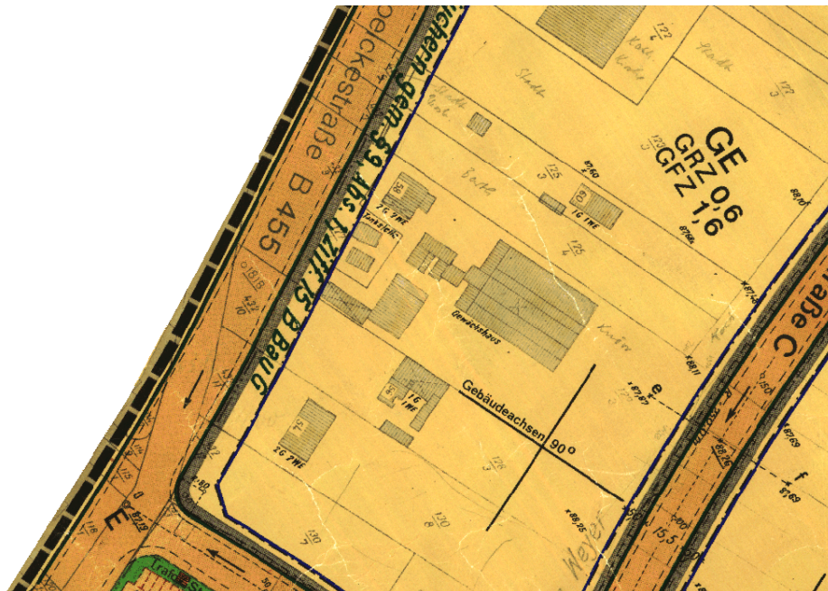
Ausschnitt aus dem Bebauungsplan

Erstellt: Stadtplanungsamt Gustav-Stresemann-Ring 15 65189 Wiesbaden stadtentwicklung@wiesbaden.de