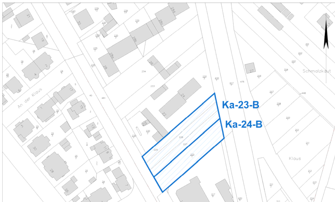
Ausschnitt aus der Stadtgrundkarte

Anmerkungen: Kastel 1960/01 Plan nach dem Hessischen Aufbaugesetz, der nur Bau- und Straßenfluchtlinien festsetzt. Im Übrigen erfolgt die Beurteilung nach § 34 BauGB - Zulässigkeit von Vorhaben innerhalb der im Zusammenhang bebauten Ortsteile.