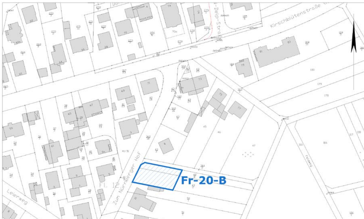
Ausschnitt aus der Stadtgrundkarte