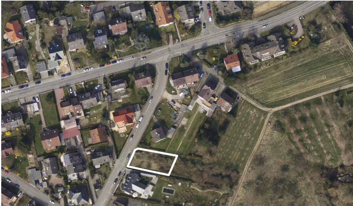
Luftbild (März 2011)

Kartengrundlage Tiefbau- und Vermessungsamt