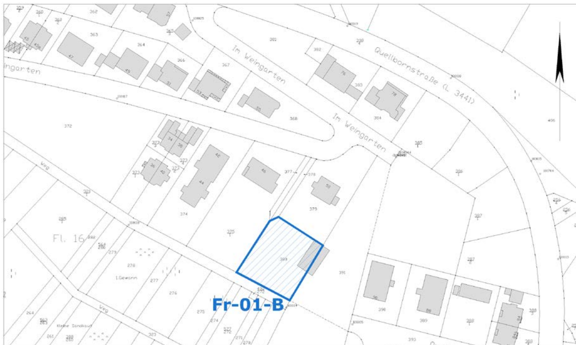
Ausschnitt aus der Stadtgrundkarte