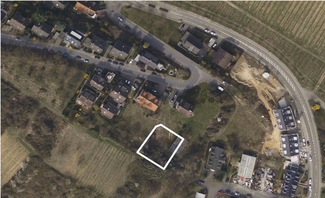
Luftbild (März 2011)