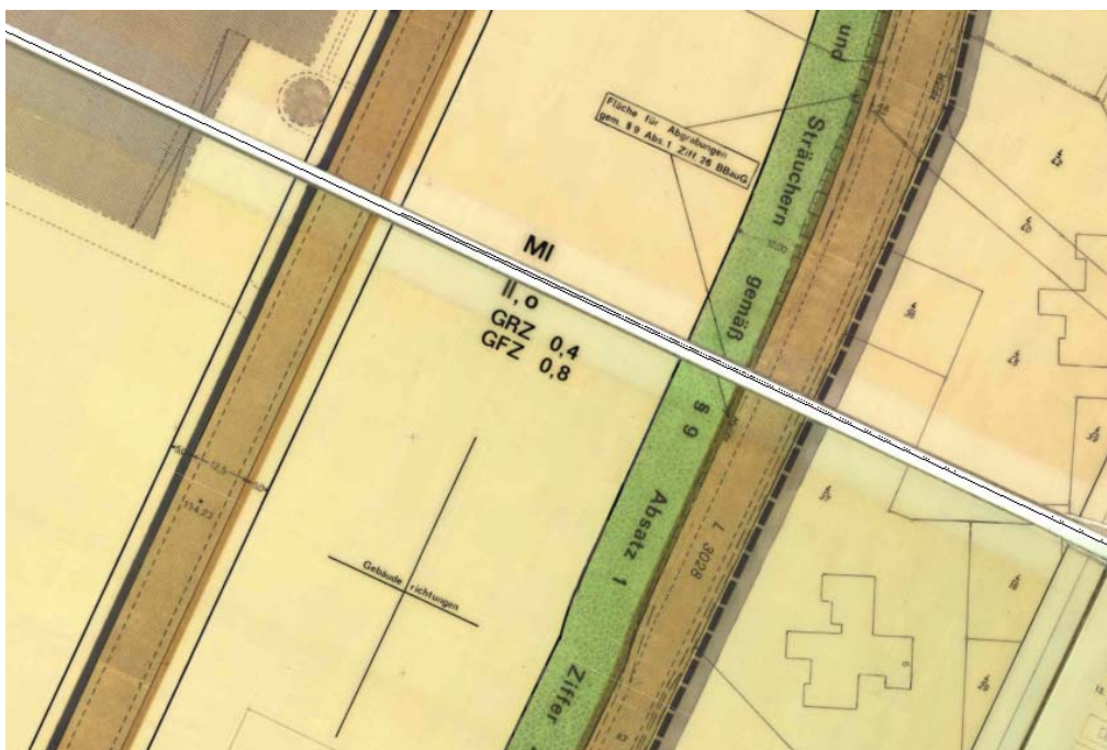
Ausschnitt aus dem Bebauungsplan

Erstellt: Stadtplanungsamt Gustav-Stresemann-Ring 15 65189 Wiesbaden stadtentwicklung@wiesbaden.de