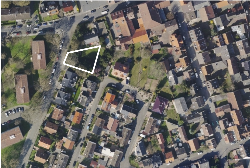
Luftbild (März 2014)