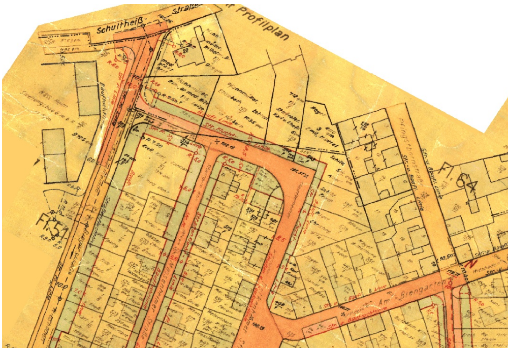
Ausschnitt aus dem Plan nach dem Hessischen Aufbaugesetz

Erstellt: Stadtplanungsamt Gustav-Stresemann-Ring 15 65189 Wiesbaden stadtentwicklung@wiesbaden.de