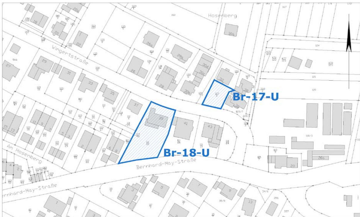
Ausschnitt aus der Stadtgrundkarte