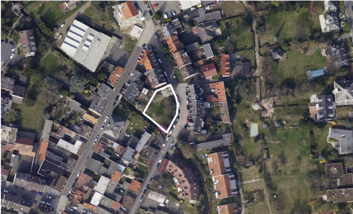
Luftbild (März 2011)