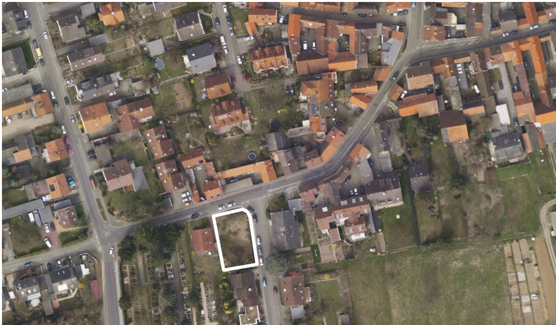
Luftbild (März 2011)

Kartengrundlage Tiefbau- und Vermessungsamt