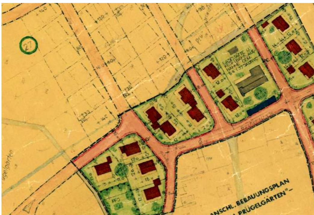
Ausschnitt aus dem Bebauungsplan

Erstellt: Stadtplanungsamt Gustav-Stresemann-Ring 15 65189 Wiesbaden stadtplanung@wiesbaden.de