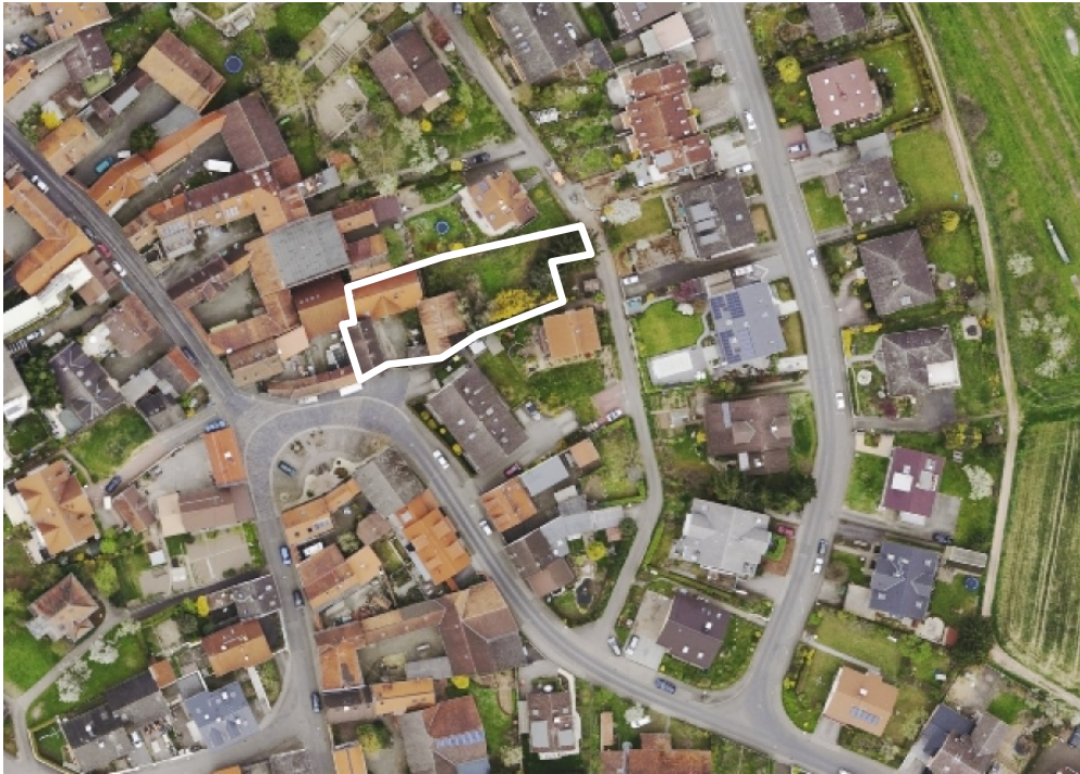
Luftbild (März 2014)

Erstellt: Stadtplanungsamt Gustav-Stresemann-Ring 15 65189 Wiesbaden stadtentwicklung@wiesbaden.de