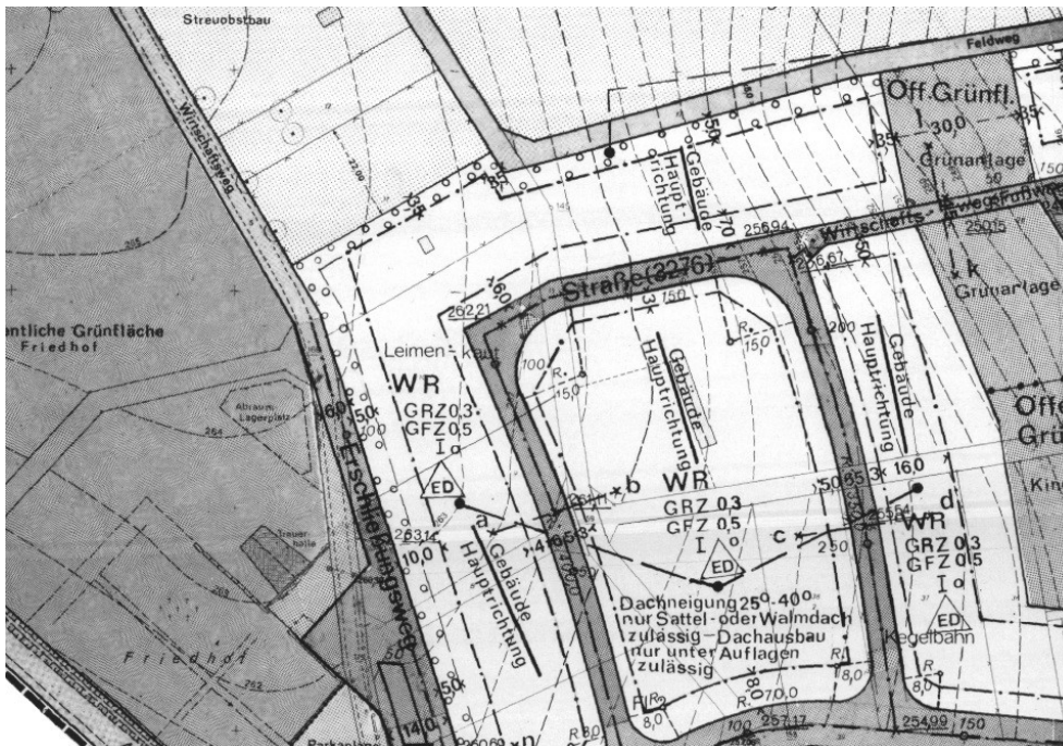
Ausschnitt aus dem Bebauungsplan

Erstellt: Stadtplanungsamt Gustav-Stresemann-Ring 15 65189 Wiesbaden stadtentwicklung@wiesbaden.de