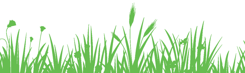
Gert-Uwe Mende Oberbürgermeister

A handwritten signature in blue ink that reads "Gert-Uwe Mende". The signature is fluid and cursive.