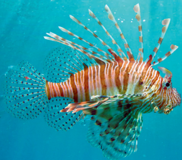
Lebenserwartung: 4 Jahre