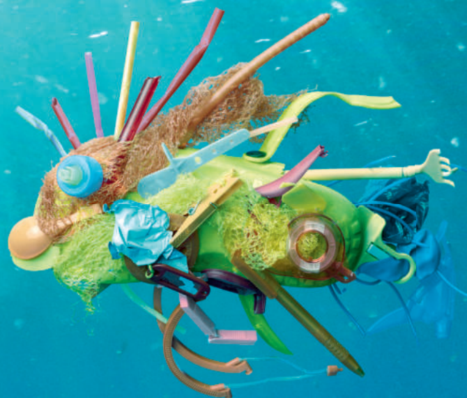
Lebenserwartung: 400 Jahre

Es dauert Hunderte von Jahren, bis sich Plastikabfall zersetzt. Unsere Ozeane drohen zu gigantischen Mülldeponien zu werden – mit tödlichen Folgen für die Meeresbewohner. Unterstützen Sie unsere Kampagne für saubere Meere: oceancare.org