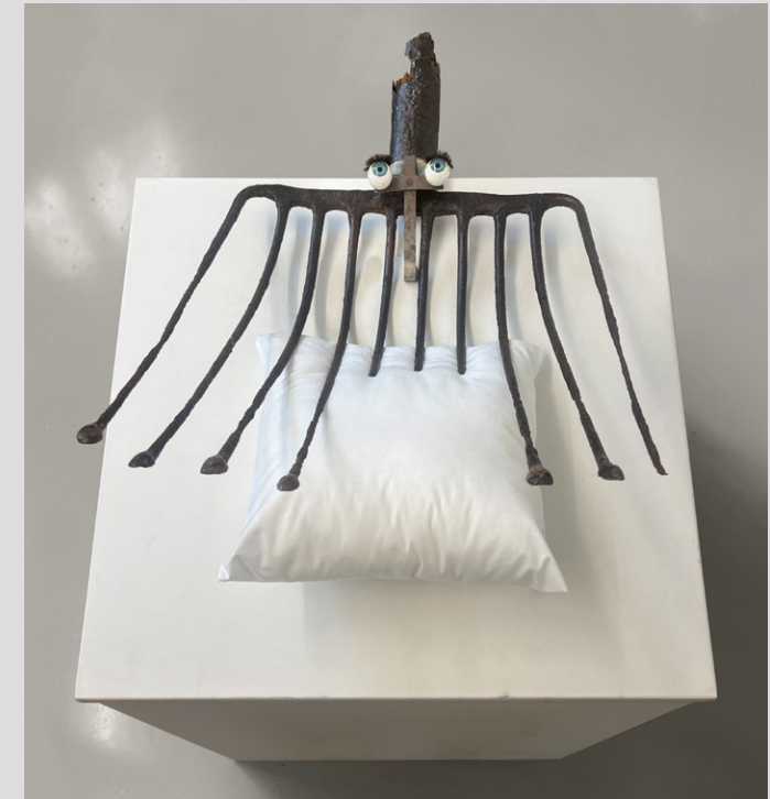
Ohne Titel, 2024, Kissen, Heugabel, Puppenaugen, 67 x 47 x 50 cm