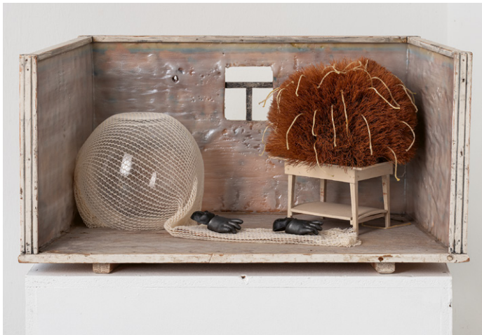
Ohne Titel, 2013, Holz, Glas, Wachs, Kunststoff, 35 x 66 x 31 cm